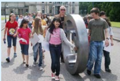
An dem Rollen der Skulptur kann sich jeder beteiligen. Die Künstler sind an diesem Tag mit uns unterwegs.

Es wird eine rollende Skulptur durch Seelscheid bewegt. Am Zielort der Aktion – der Evangelischen Dorfkirche – wird vor der Eingangstreppe zur Kirche die Engel der Kulturen-Bodenintarsie, in Bernburg/Sachsen-Anhalt entstanden, ihren dauerhaften Platz finden.