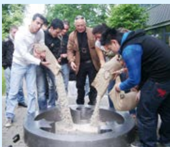
Die Stahlskulptur wird an den Stationen auf die Seite gelegt und ihr Inneres wird mit weißem Quarzsplitt gefüllt. Dieser wird von den Anwesenden gemeinsam per Hand geglättet.

An den Stationen wird gemeinsam ein temporärer Sandabdruck erzeugt. Aus weißem Quarzsplitt entsteht ein vergänglicher Abdruck des Engel der Kulturen. Danach gehen wir gemeinsam zur nächsten Station.